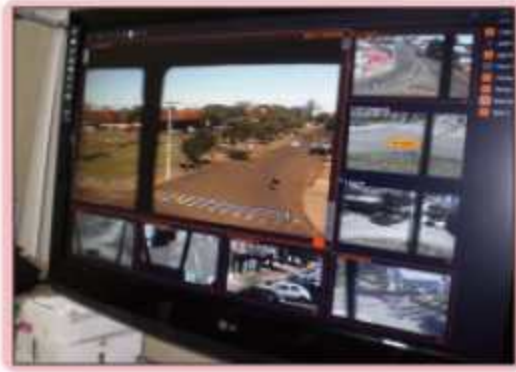
Sistema de monitoramento em Toledo

Câmara lidera movimento para colocação de Câmeras de Vídeo em pontos estratégicos da cidade, visando prevenção e monitoramento de roubos, assaltos, infrações de trânsito e colaboração para com as Polícias Civil e Militar.