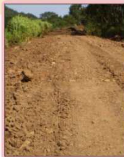
Readequação de estradas no interior

Por merecimento, o setor agrícola precisa sempre de boas estradas. Os vereadores estiveram atentos a este fator, ouvindo as reclamações dos agricultores e exigindo rápidas soluções, principalmente no quesito estradas cascalhadas, onde pedras soltas e buracos tornam a trafegabilidade muito difícil, exigindo manutenção constante.