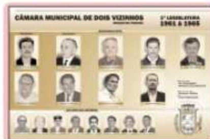
Vereadores da 1ª Legislatura - 1961 a 1965

As 12 Legislaturas da história do Poder Legislativo contam com um Memorial Digital. No site da Câmara, as fotos de todos os vereadores que já passaram pela Câmara ao longo de 49 anos do município podem ser visualizadas.