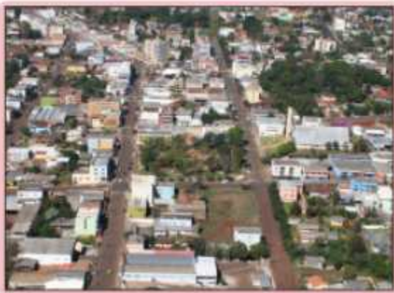
Centro da cidade de Dois Vizinhos

Durante os últimos anos, grande número de ruas foi asfaltado, principalmente nos bairros. O progresso do município também aumentou fortemente o número de automóveis trafegando. Esses dois fatores exigem hoje, uma urgente intervenção do Poder Público. A Câmara, através de pedidos da comunidade, indicou dezenas de faixas elevadas, alterações táticas na forma de estacionar, placas e sinalizações, entre outros pontos, visando aumentar a segurança, diminuir os acidentes e desafogar o trânsito. Uma indicação da Câmara e posta em prática pela ACEDV e município, foi o uso de lotes baldios para estacionamento.