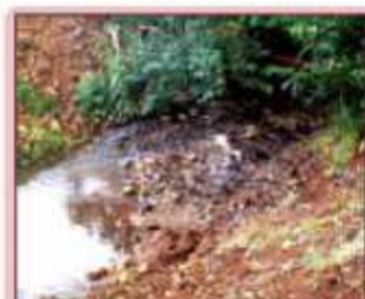
Rio Jirau durante a estiagem

Economia de água durante o período de estiagem, alertas de cuidados no trânsito, esclarecimentos sobre licitações públicas, são algumas das campanhas realizadas pela Câmara neste primeiro semestre. Utilizando de espaços na imprensa, a Câmara tem participado ativamente, visando ser um elo de informação e ação com o município.