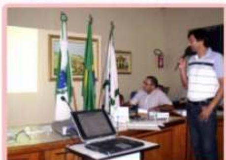
Contador da Câmara faz quadrimestralmente a prestação de contas em audiência pública

Neste semestre foi implantada a ordem de serviço e cotação de preços. Na prática, isso quer dizer que cada aquisição de produtos e serviços feitas pela Câmara, mesmo que abaixo dos limites que a lei dispensa o uso de licitações, a Câmara tem priorizado preço e qualidade, onde pelo menos 3 orçamentos são apresentados, bem como uma pesquisa tanto local e regional, quanto via internet. Posteriormente os participantes são notificados quanto ao orçamento ganhador.