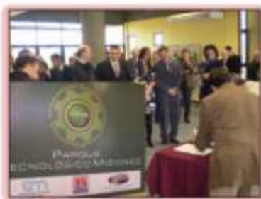
Encontro em Misiones