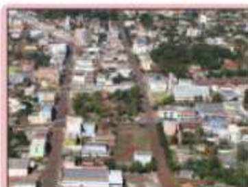
Cidade de Dois Vizinhos