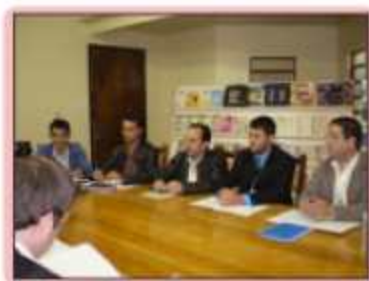
Reunião com Lideranças e empresários

Dois projetos já estão tramitando. Um institui o Fundo Especial da Câmara Municipal de Dois Vizinhos - FECDV. E outro institui o Conselho Municipal de Ciência, Tecnologia, Inovação e Desenvolvimento de Dois Vizinhos - CM-CTID-DV. Visando obter mais conhecimentos, a Câmara tem feito várias visitas a empresas do setor, bem como esteve em junho, participando em Posadas, Província de Misiones, na Argentina (550 km), de vários momentos envolvendo a ciência da tecnologia, dentre eles, a inauguração do Centro de Convivência Tecnológica da Universidade Nacional de Misiones - UNAM (que por um termo de parceria, poderá ser utilizado pela UTFPR), e a visita a Biofábrica Misiones e projetos ligados a essa Universidade.