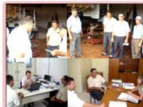
Câmara visitando secretarias municipais

Os vereadores estão de olhos abertos aos atos do Executivo. O ato de fiscalizar é uma das principais funções da Câmara, garantindo lisura e responsabilidade com o uso do dinheiro público.