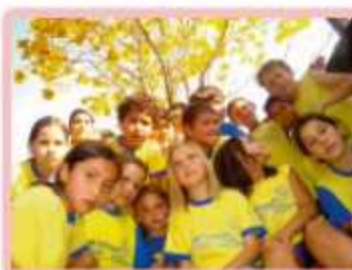
Crianças da AABB - com esta foto conseguiram uma excelente posição em concurso nacional

O Poder Legislativo tem feito visitas a organizações do município. Uma delas foi a AABB Comunidade. Na oportunidade a equipe AABB falou do funcionamento do projeto e como a Câmara e Sociedade podem ser úteis para fortalecer ações que beneficiam as crianças do município.